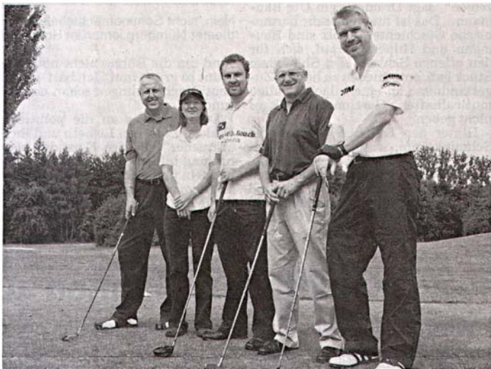
Spendenfreudige Golfer: Bei einem Turnier des Vereins „Vision for the World“ kamen 5500 Euro für die Verhütung und Heilung von Blindheit in den Ländern der Dritten Welt zusammen.

Trotz starker Konkurrenz gelang es den Fürthern, viele vordere Platzierungen zu erreichen und die Gesamtsiegerin des ersten und zweiten Ausbildungsjahrs zu stellen. Zudem erhielt die Friseur-Innung Fürth Stadt und Land den Wanderpokal. fn