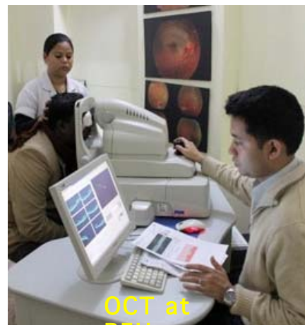
OCT at BEH

Die VR Abteilungen des SCEH und des BEH sind gut ausgestattet mit technischem Equipment.